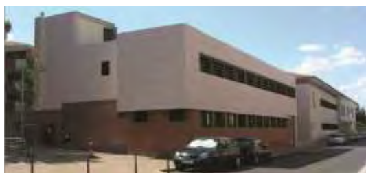
La Clinique Sainte Thérèse Psychiatrie adulte et CMP 96 lits et places