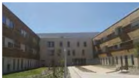
Le Centre de Gérontologie Pech Dalcly USLD : 266 lits et places