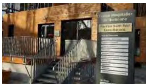
Le Plan Saint Paul Plateaux de Consultations

Le Centre Hospitalier de Narbonne dispose au total de de 663 lits et places . Il offre des services diagnostiques et assure toute la gamme des soins aigus en médecine, chirurgie et obstétrique, des soins de suite et de longue durée ainsi que des soins en psychiatrie.